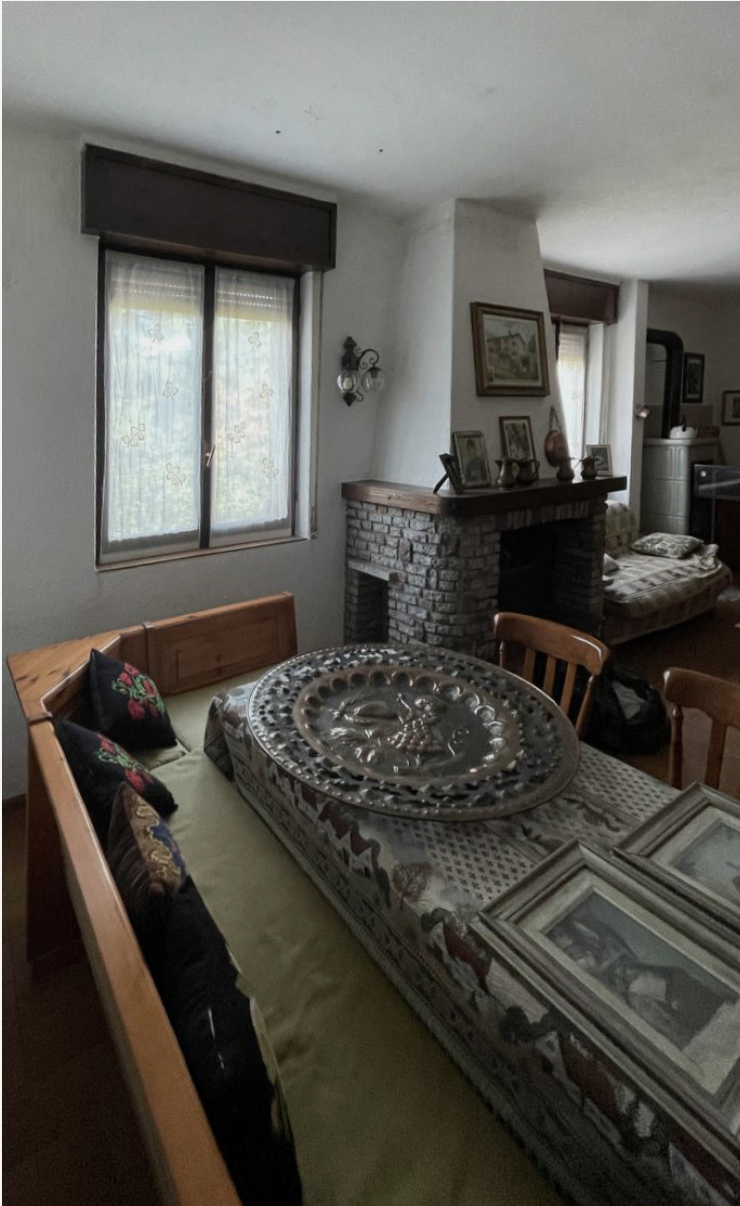
*3_ taverna_stato di fatto

Il progetto si distingue per un approccio che valorizza il contesto montano e preserva le tradizioni architettoniche locali, mantenendo la struttura portante dell'edificio nella sua configurazione originaria e rispettandone l'integrità oltre che la stabilità. L'autenticità dell'immobile e il suo legame con il contesto storico risultano inalterati, coniugando modernità e tradizione nel rispetto della solidità dell'impianto esistente.