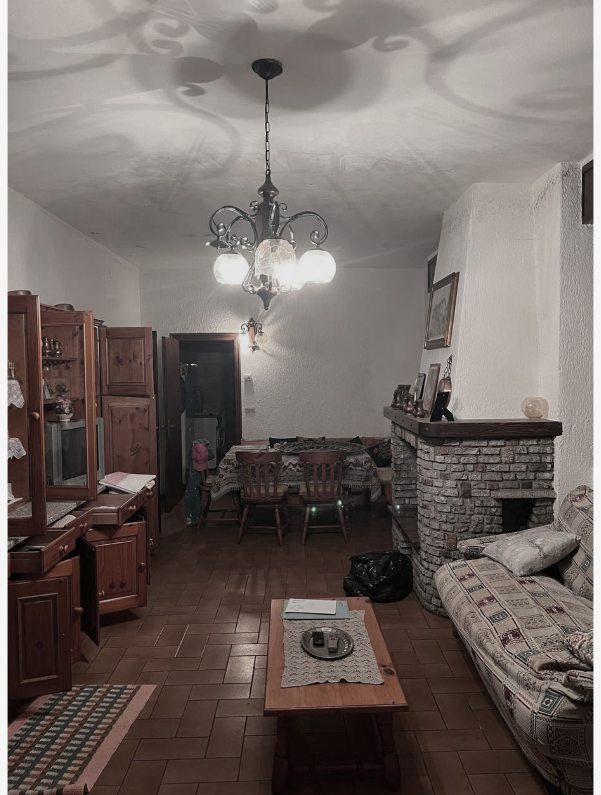
*1_ taverna_stato di fatto

Pur salvaguardando tracce di materiali naturali, l'intervento è stato reinterpretato in chiave moderna, mantenendo un dialogo costante con il contesto ed il paesaggio circostante. Questa cornice, così strettamente legata alla tradizione, ha rappresentato una base solida per l'inserimento di un loft che non solo si integra perfettamente all'ambiente, ma ne esprime anche l'evoluzione, unendo il rispetto per la storia, il carattere locale e le necessità di un design contemporaneo.