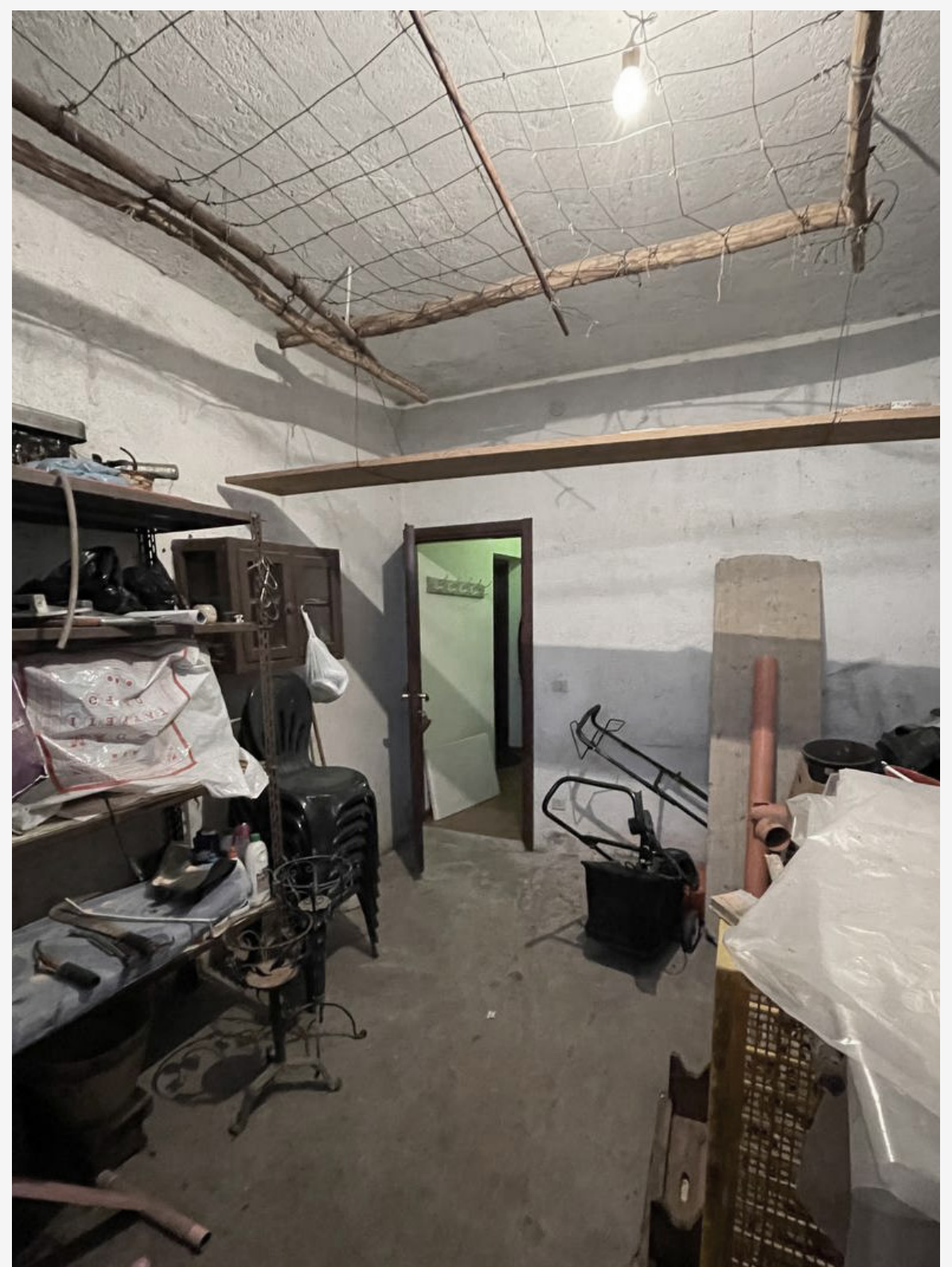
*2_ cantina_stato di fatto